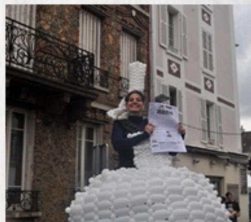
Festi Fromagse, Meulan, octobre 2019