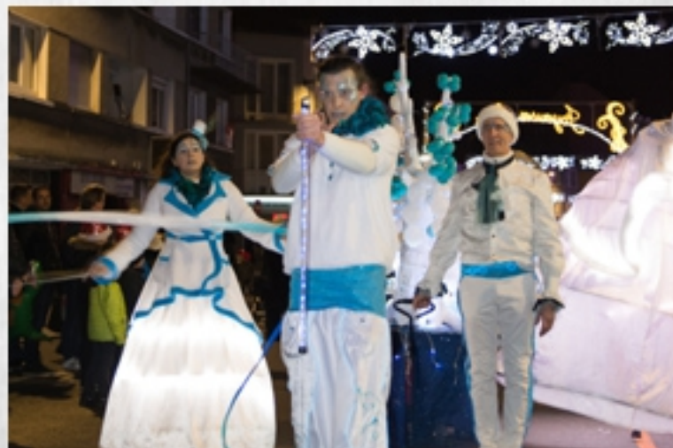
Parade de Noël, Boulogne sur Mer, Décembre 2019