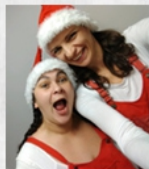
Tournée Noël, décembre 2019