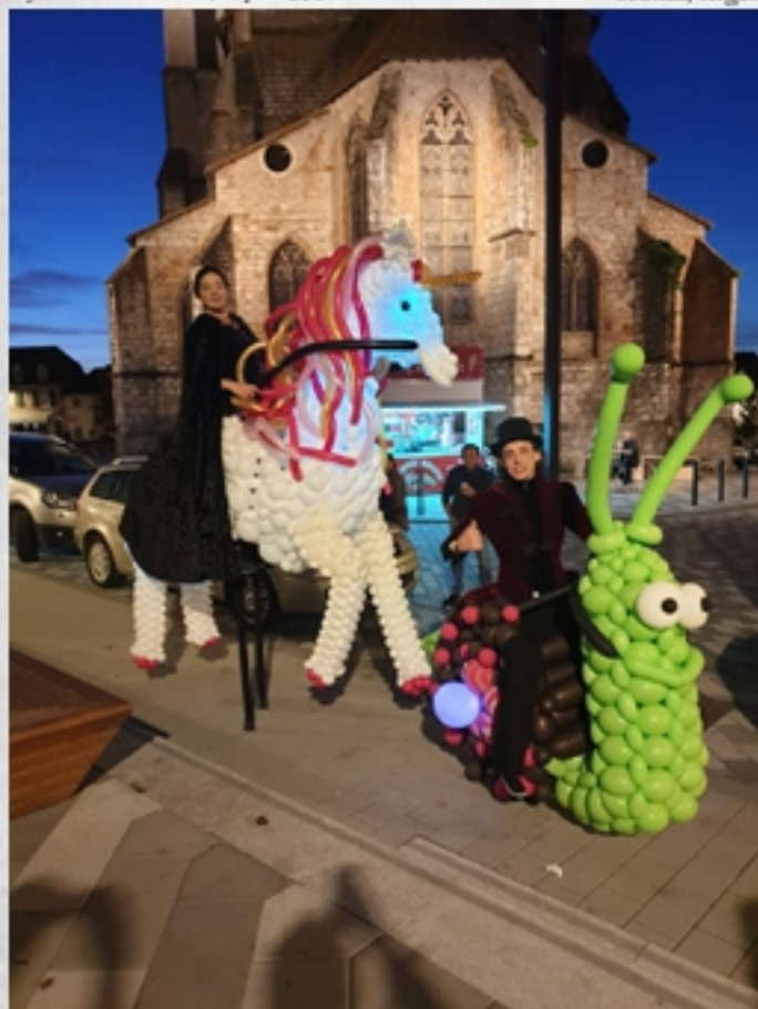
Le Noël de Floconia, Argentueil, novembre 2019