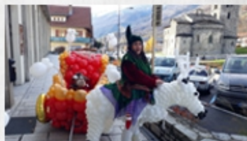
Marché de Noël, La Plagne, novembre 2019