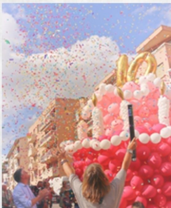
Fant'artistique, Fontaines-sur-Saône, juin 2019