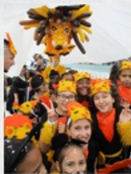
Carnaval, Puteaux, Mai 2019