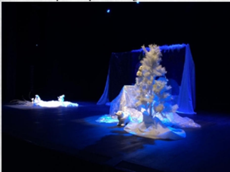
“Des rencontres au poil”

Noël est en danger!! En effet, la banquise qui entoure la maison du Père Noël est en train de fondre et le Père Noël ne pourra pas faire la distribution de cadeaux s'il ne peut sortir de chez lui. Une seule personne peut venir en aide aux lutins : Floconia, la Fée des Neiges et des Glaces. Appelée à la rescousse elle va mettre tout ce qui est en son pouvoir pour que Noël ne disparaisse pas dans la glace fondue!