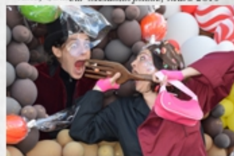
Carnaval Roumazières Loubert, Avril 2019