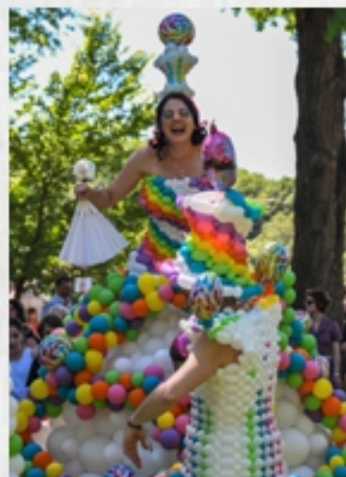
Charivari, Vertou, juin 2019