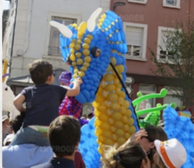
Fant'artistique, Fontaines sur Saône, juin 2019