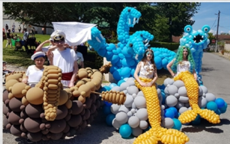
Gaminades, Montmoreau Saint Cybard, Juin 2019

Pour compléter la rubrique "Souvenirs, souvenirs" et vous faire voyager au travers de nos prestations, voici quelques instantanés parmi les plus marquants de ces derniers mois.