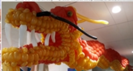
Asie, Couleur Métamorphose, Mars 2019